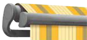
graualuminium struktur (RAL 9007 Feinstruktur)

leichtern können. Achten Sie z.B. auf die Farbe Ihrer Markise. Ein weiteres Argument ist das Umfeld: Hausfarbe, Dachfarbe, viel Pflanzen, Blütenfarben, Lieblingsfarbe.